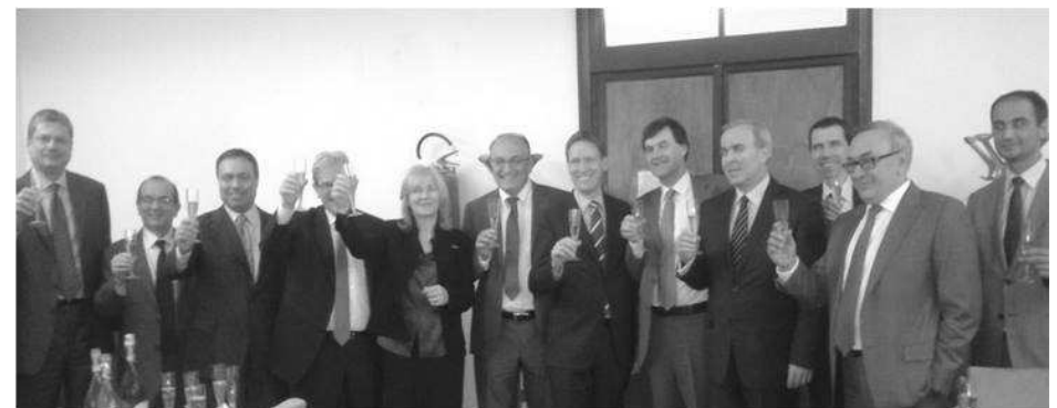
Un momento del brindisi per il TAP alla presenza del Viceministro del Ministero degli Affari Esteri Dassù, del Sottosegretario del Ministero dello Sviluppo Economico De Vincenti e del Capo del Dipartimento Energia Senni.

Questo “viaggio” tra le Nazioni che dovranno essere attraversate dal gasdotto porta a considerare che “l’aumento degli approvvigionamenti e la diversificazione delle fonti di gas per i mercati europei”, siano frutto di logiche economiche che niente hanno a che fare con le popolazioni e i luoghi coinvolti. Al contrario, queste logiche, oltretutto finalizzate all’accaparramento delle materie prime, come il gas naturale nel caso specifico, tentano di mettere in concorrenza il gas delle regioni mediorientali con quello di Russia, Algeria, Libia, a esclusivo vantaggio delle società energetiche, con tutto quello che ciò comporta a livello di occupazione dei territori camuffata da interventi umanitari quando le situazioni di instabilità politica esplodono; si pensi all’Iraq, all’Afghanistan e la Libia e le guerre mosse nei loro confronti anche per il controllo diretto delle fonti energetiche. A ben vedere, questo vantaggio di cui TAP ha parlato, non si riesce proprio a riconoscerlo. Molti già lo sapevano semplicemente perché la democrazia figlia del capitalismo è una parola vuota. L’immagine che la rende al meglio è quella di due lupi ed una pecora che, democraticamente, decidono cosa mangiare a cena.